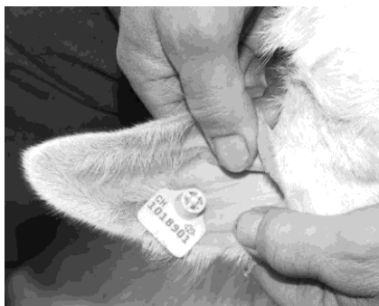
Position correcte de la marque auriculaire