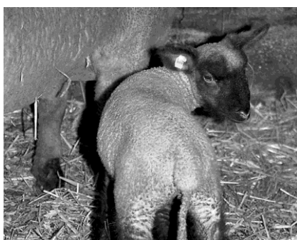
Agneau correctement marqué